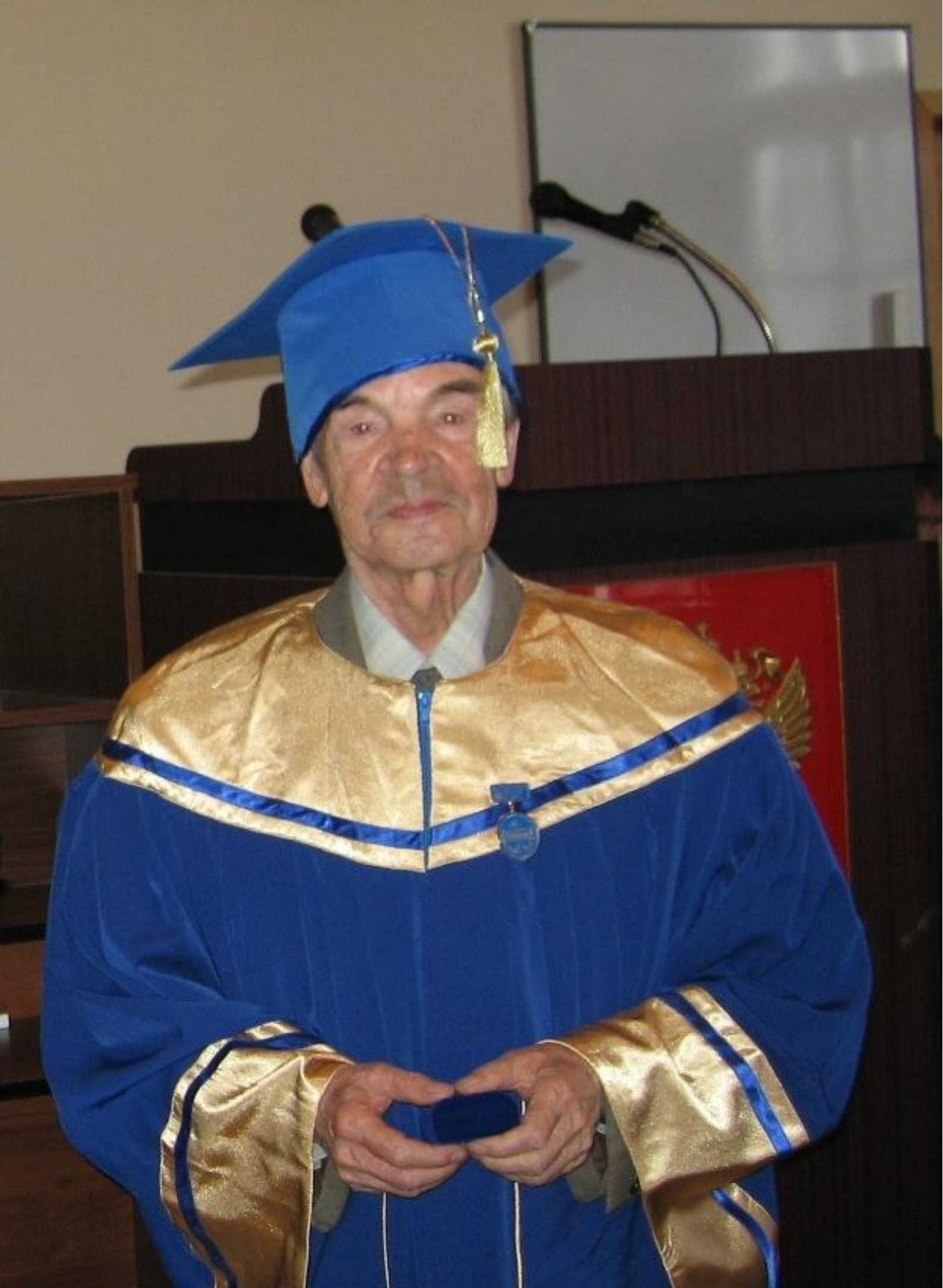
Почетный профессор - 2007 г.