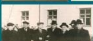
Получение ордена «Знак Почёта»