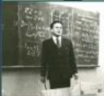
1977 год - перед лекционной кафедрой