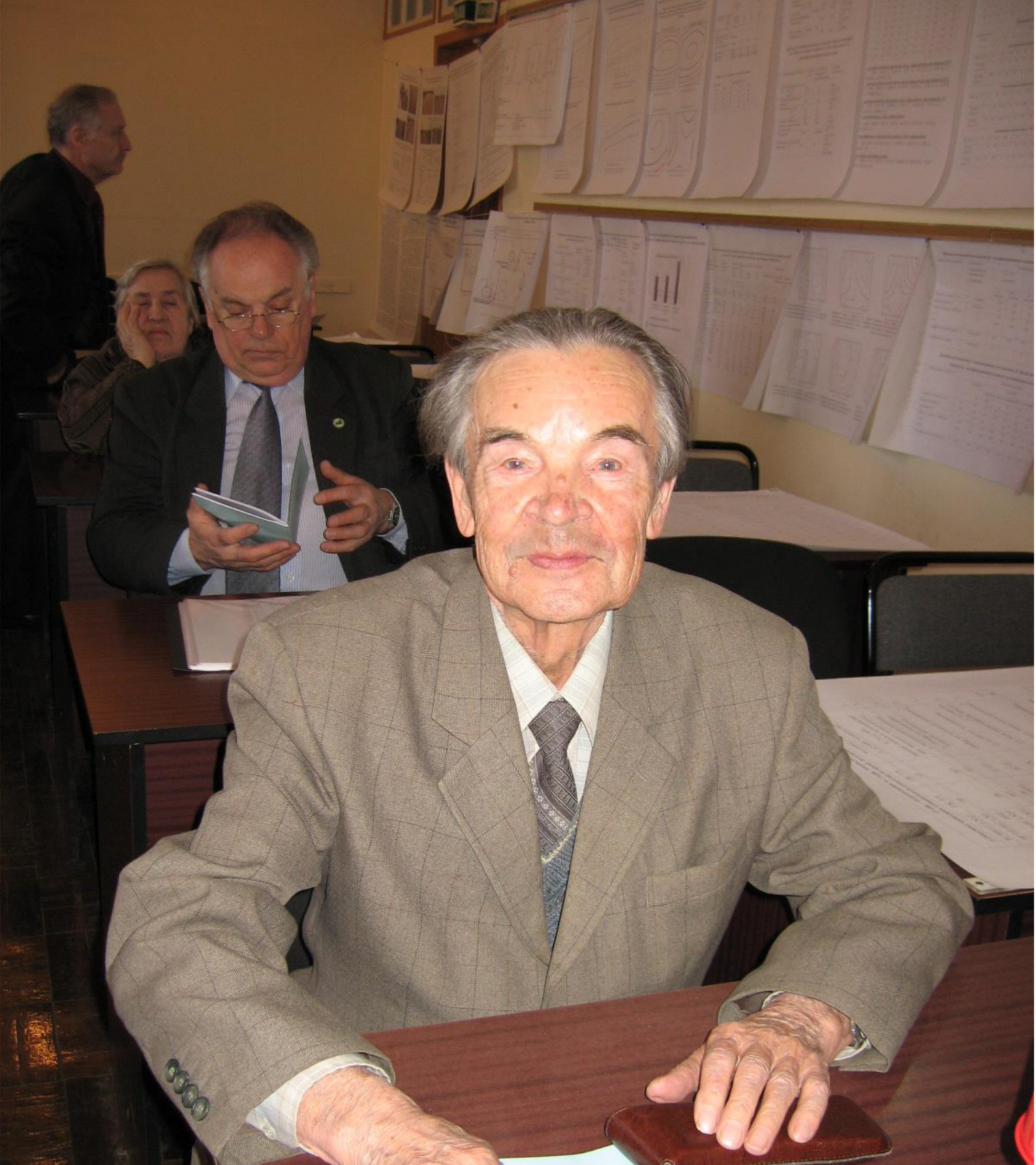
Член Ученого совета