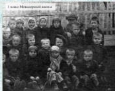
Голод Межадорской школы