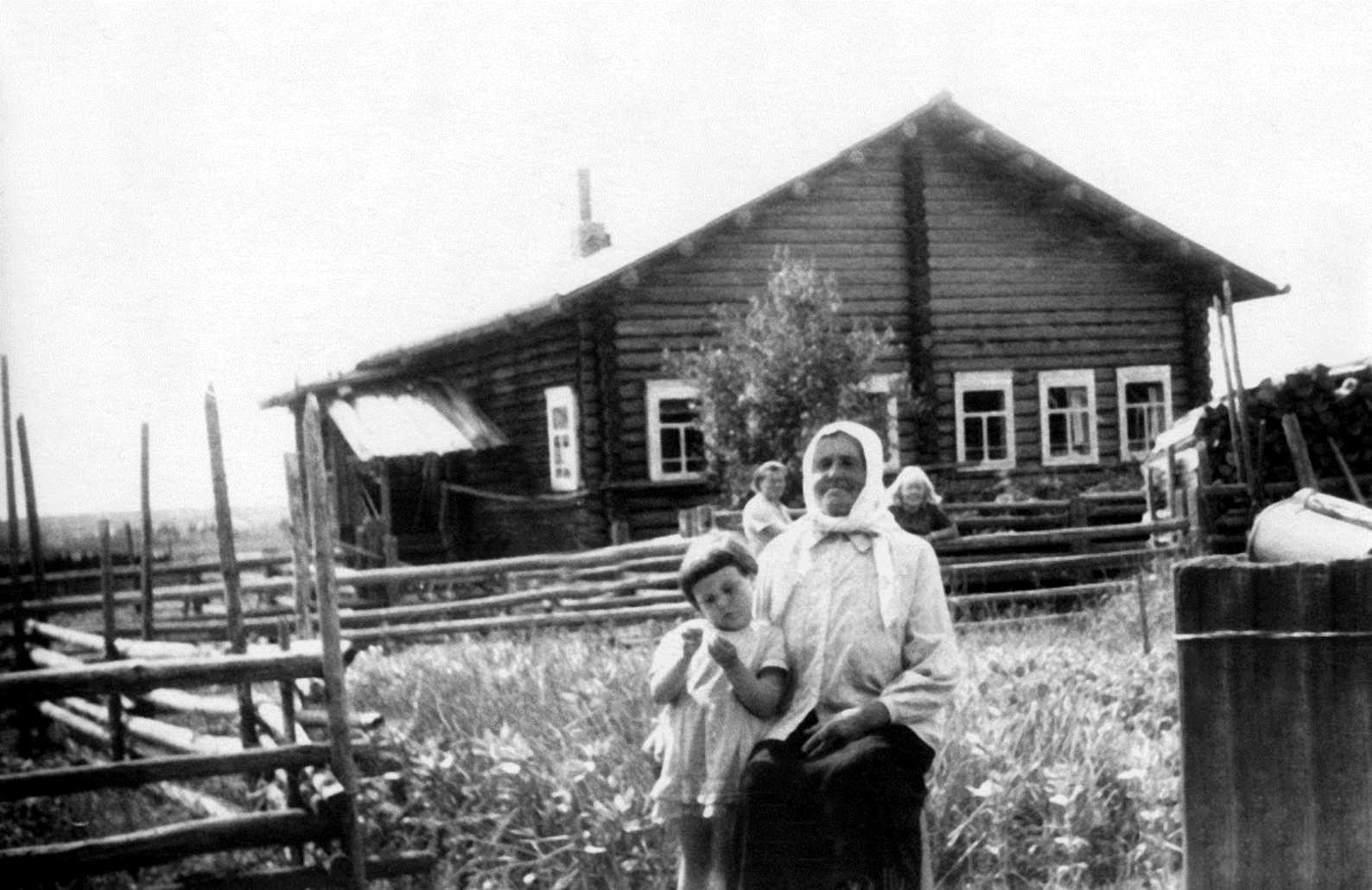
Родительский дом в селе Межадор, деревня Утога