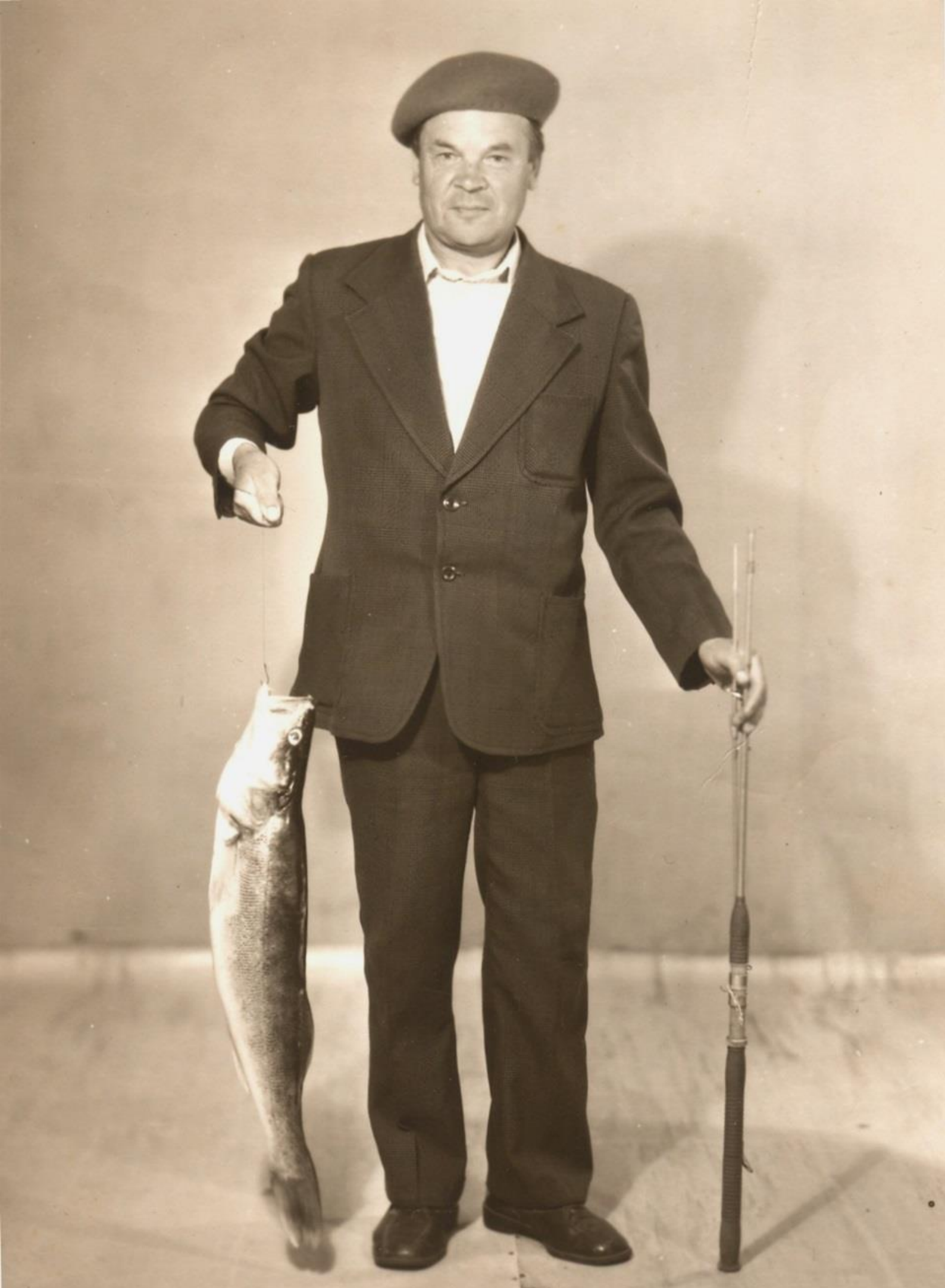
Удачный улов - сентябрь 1983 г.