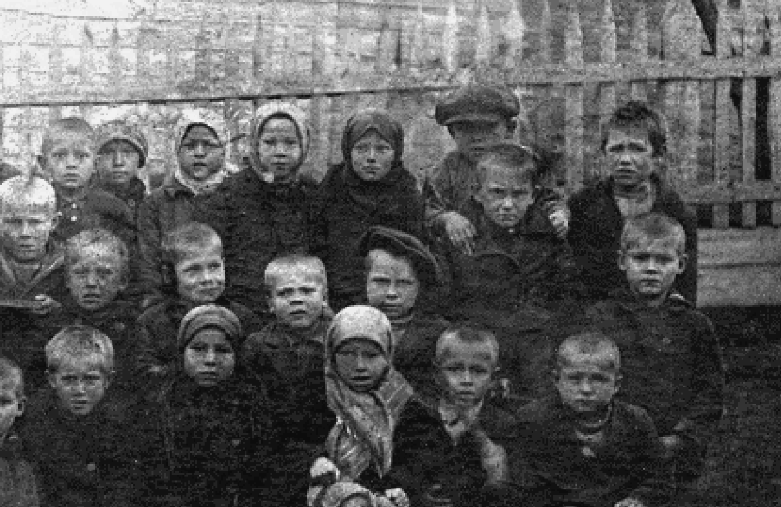
Первый класс межадорской школы