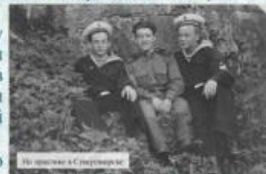
На практике в Стрелковском