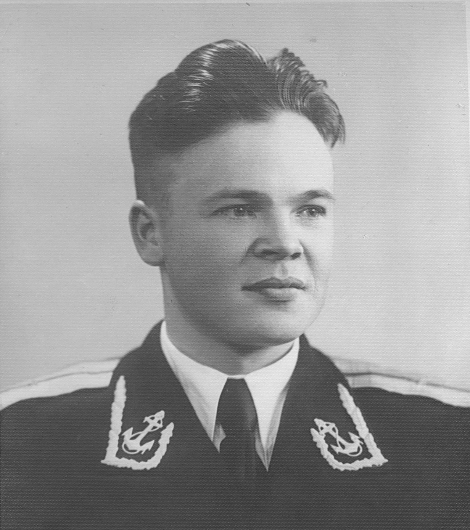
Выпускник Ленинградского инженерно-строительного института, 1955 г.