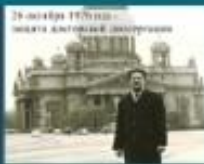
29 октября 1970 год ИЗДАНИЕ АКАДЕМИИ НАУК СССР